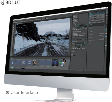
※ User Interface